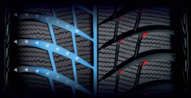
Spezielle entwickelte Kanäle räumen Wasser und Schneematsch von der Kontaktstelle weg nach außen